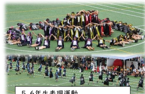
5、6年生表現運動 「想いを未来へ! 田道ソーラン!」

勝利を目指して最大限の力を発揮しようとする姿、その姿を全力で応援する姿は、まさにスポーツの醍醐味であり、嬉しさや悔しさを味わう大切な機会となりました。ただ、それに留まることなく、一人では成立しないこと、仲間やライバルがいるから、応援するご家族、支える係・教職員がいるからこそ成り立っているという大事な事も学べたのではないかと感じています。今回の春開催での運動会が、学級や学年の絆が深まる思い出に残る行事になっていたら、嬉しい限りです。