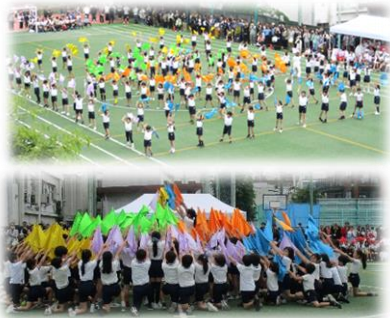
3、4年生表現運動 「出航! 130名の大冒険」の様子

日本で初めて運動会が開催されたのは1874年(明治7年)、東京・築地の海軍兵学寮で催された「競闘遊戯会」とされています。このころから、身体を鍛えることを主眼にしながらも、楽しむことを忘れない大切な行事であったことが窺えます。