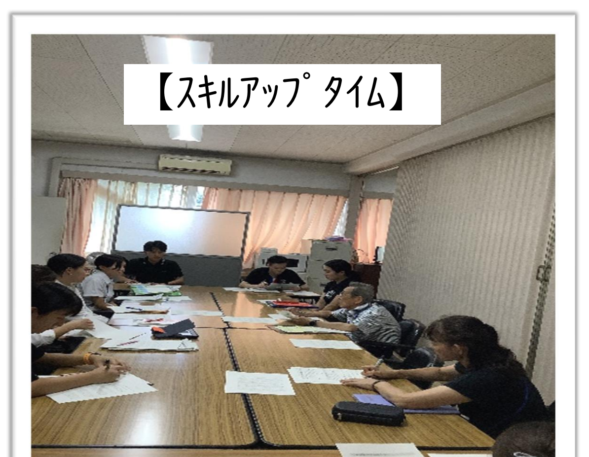
【スキルアップタイム】