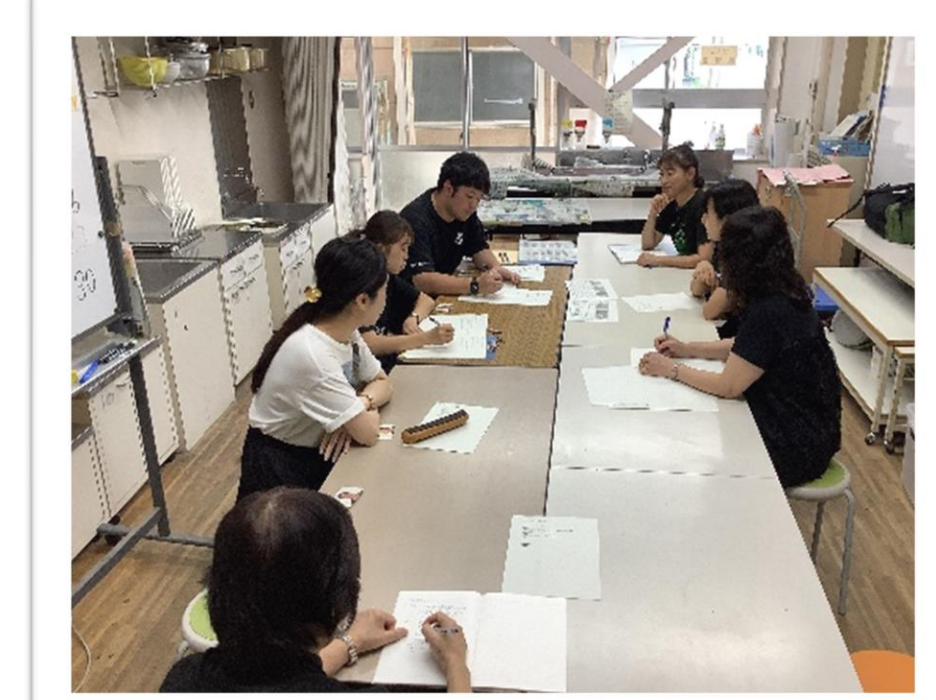
【アセスメントタイム】

メンバーは、特別支援教育コーディネーターをはじめ、管理職、生活指導主任、養護教諭、SC、特別支援教室専門員などである。