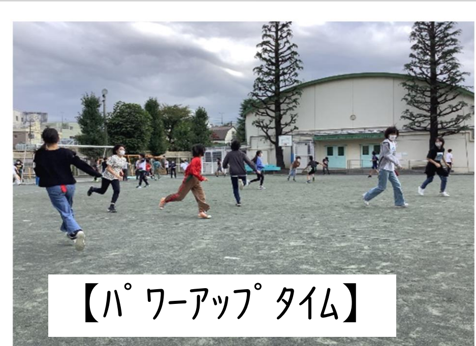
【パワーアップタイム】